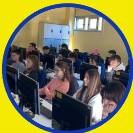
02. CULTURA SCIENTIFICA E STEM