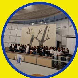
04. CITTADINANZA CONSAPEVOLE