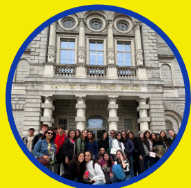
01. COMUNICAZIONE E LINGUAGGI